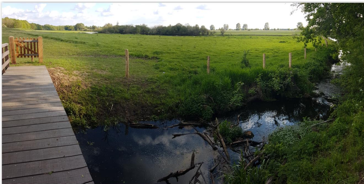
Richting Genneep met het nieuwe bruggetje over de Kroonbeek

Bij de reconstructie van de dijk aan het einde van de Bloemenstraat is een kleine pleisterplaats aangelegd. De kleine parkeerplaats en rekken voor fietsen en de picknickbank nodigen uit om van het uitzicht op de Niers te genieten. Vanaf de pleisterplaats kan in twee richtingen worden gewandeld. Onderlangs de dijk langs de Bloemenstraat richting Genneperhuis of via het nieuwe bruggetje over de Kroonbeek richting Genneep.